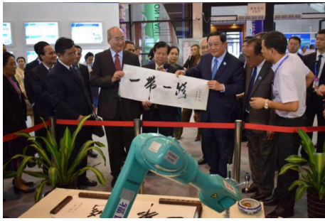
老挝副总理参观“福匠”书法机器人