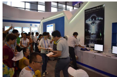
观众排队体验“太空宝宝”眼睛治疗仪