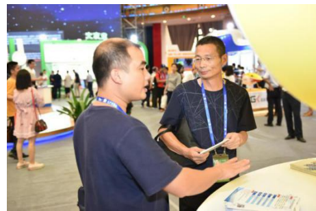
新能源项目现场对接