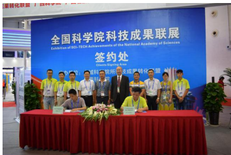
展出项目现场签约