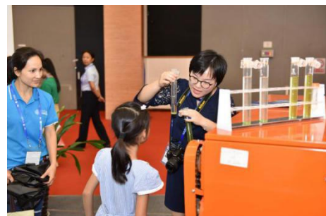
现场观众科普展示